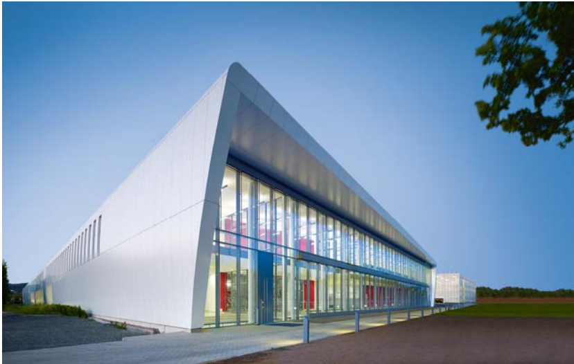
„Produktionshalle“ in Niesetal

Die 30 bestplatzierten Projekte des Prime Property Award 2010 werden in einer Buchpublikation ausführlich porträtiert. Die Ausschreibung für den Prime Property Award 2012 beginnt im Herbst 2011. Weitere Informationen unter www.prime-property-award.de