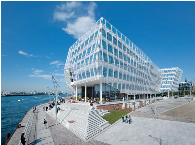
„Unilever-Haus“ in Hamburg

Der 3. Preis des Prime Property Award 2010 ging an die Hochtief Projektentwicklung GmbH für das neue „ Unilever-Haus “ in Hamburg (Architekt: Behnisch Architekten Stuttgart). Das im September 2009 fertig gestellte, rund 22.800 m 2 Nutzfläche umfassende Landmark-Gebäude ist für 15 Jahre vollständig an Unilever vermietet und seit Jahresbeginn im Besitz der REEF Investment GmbH. Mit seiner transparenten Außenfassade präsentiert sich der Neubau als attraktiver Blickfang der Hamburger HafenCity. „Aufgrund seiner optischen und ökologischen Qualitäten, insbesondere auch durch seine offene Kommunikationsarchitektur, ist das neue ‚Unilever-Haus‘ ein Vorbild für zukünftige Bürogebäude“, begründete Jurymitglied Dr. Frank Billand, Geschäftsführer der Union Investment Real Estate GmbH, die Entscheidung der Jury.