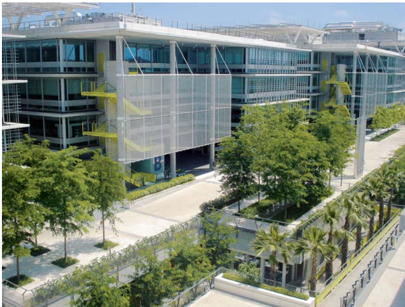
„Palmas Altas Technological Center“ in Sevilla

nachhaltigen Architektur. Den aus sieben Gebäuden mit rund 55.000 m 2 Bürofläche bestehende Technologiepark (Architekt: Richard Rogers & Vidal Architecture Team) würdigte die Jury als Paradebeispiel für die Nachhaltigkeit von Architektur und Technik: „Unter Einsatz regenerativer Energien und innovativer Technologien ist in Sevilla ein außergewöhnliches und zugleich beispielgebendes energetisches Gebäudekonzept realisiert worden, das Zeichen setzt und bereits Nachahmer gefunden hat“, sagte Jurymitglied Garrie Renucci, Partner bei Gardiner & Theobald, bei der Preisverleihung im Rahmen der Sustainable Investment Conference.