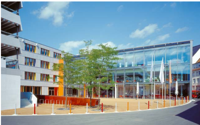
„Neue Stadtbücherei“ in Augsburg